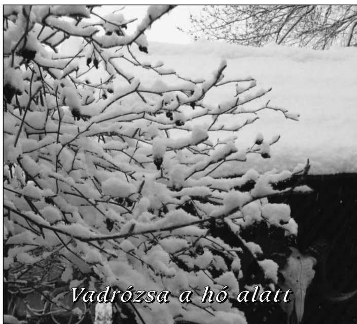
Vadrózsa a hó alatt