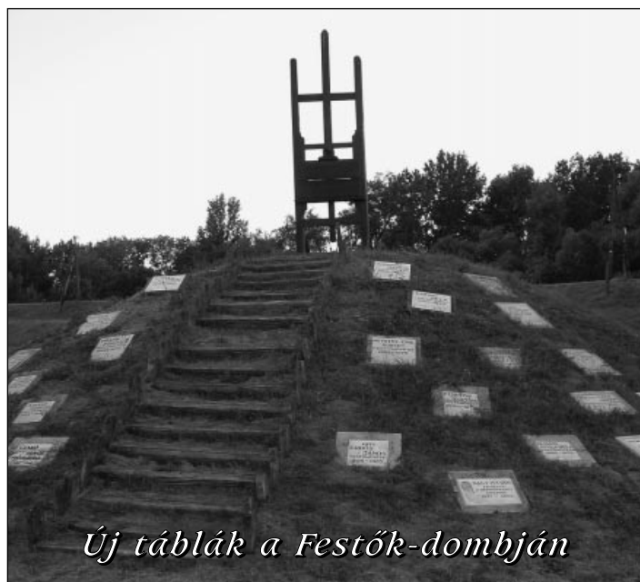
Új táblák a Festők-dombján