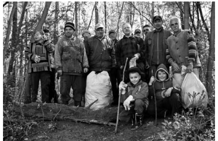
A vásárhelyi horgászok önkéntes szemétszedő csapata. Ekkor a holtágon úszó szemét összeszedésére került sor

Frissebb történet a vízhúzó fölött, a hullámtérre, a gát lábától öt-hat lépésre leöntött szemétrakás históriája. Amit a rest