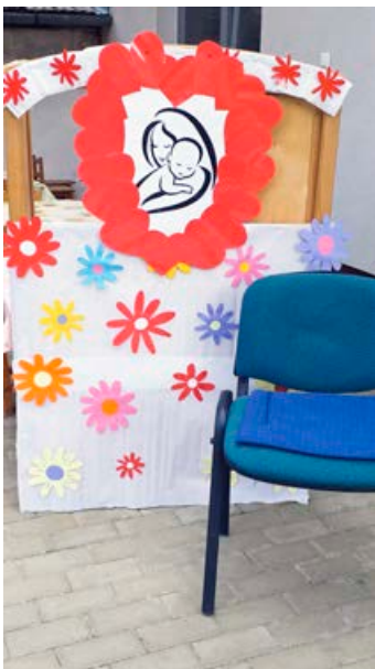
A fotósarok, amit az óvónők rendeztek be az Anyukáknak és csemetéiknek

A hagyományokkal ellentétben teljesen máshogy szerveztük az Anyák napját, erre pedig kifejezetten büszkék vagyunk, mert úgy hallottuk, hogy a legtöbb oviban elmaradt ennek a jeles napnak a megünneplése. Sajnos tavaly nálunk sem került megrendezésre, mert teljesen zárva voltunk. Idén csoportonként minden kisgyermek tanult verset, készítettünk