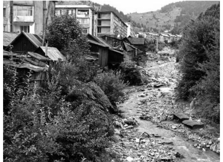
Borsabánya, ahonnan a nehézfém-szennyezés elindult

töt mosott ki. A fémtartalom a víz lebegőanyagához kötődve eredményezte az V. osztályú, erősen szennyezett vízminőséget. A folyó sodrása miatt a kiülepedés következtében a tiszabecsi határszélvénybe érkezett réz még száznyolcvan szoroson haladta meg a határértéket, ez Mártélyra jutva „csak” tizenhatszoros értékű lett. A többi fémre is ugyanez volt jellemző, de az akkori áradás miatt jelentős volt a hullámtéri kiülepedés.