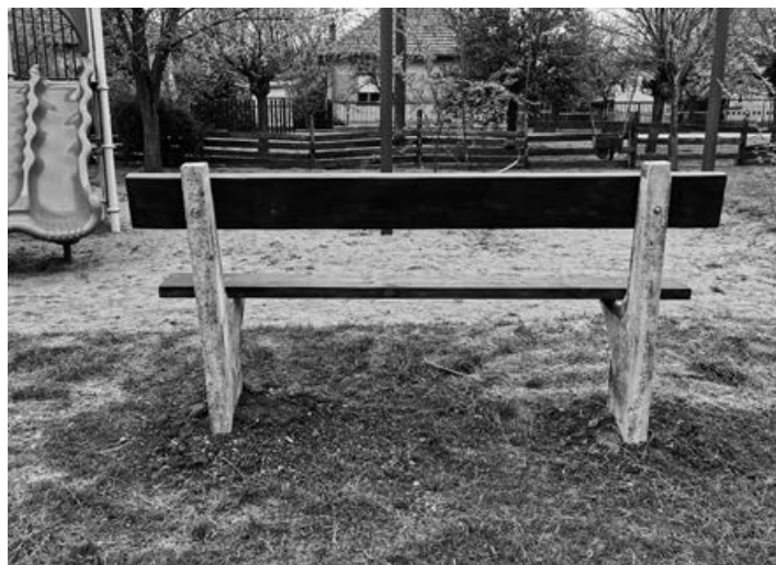
A közfoglalkoztatottak által összeszerelt egyik pad

A mártélyi közfoglalkoztatásban dolgozóknak köszönhetően 2 új paddal bővült az újfalusi játszótér. A padokhoz használt betont egy régebbi, használaton kívüli padból vették elő, míg a faanyagot újonnan vásárolták, lefestették, ezt az Önkormányzat finanszírozta. Egyelőre csak ez a két pad készült el, de még több helyre tervbe van véve további ülőalkalmatosságok elkészítése és kihelyezése.