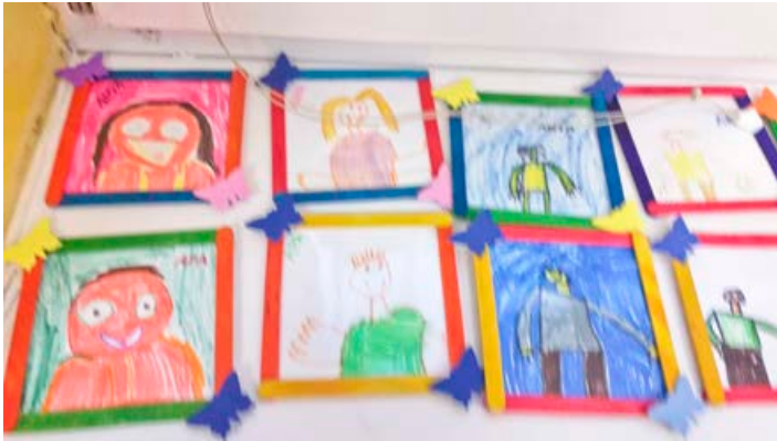
Az ajándékok, melyeket az ovisok az Édesanyák részére készítettek

A pandémiás helyzet miatt bő hónapig zárva tartottak az óvodák és iskolák. Április 19-ével azonban újra visszatérhettek az ovisok a mártélyi óvoda falai közé. „Örömmel vették a szülők a nyitást, gyakorlatilag majdnem minden kisgyermek jött egyből, orvosi papírhoz nem volt kötve a gyermekek óvodába hozatala. Azon szülők gyermekeinek, akiknek dolgozniuk kellett a pandémiás időszak alatt is biztosítottuk a felügyeletet. Az ebédet elhordhatták azok is, akik otthon voltak, ezt államilag biztosították. A kellő intézkedéseket, melyeket egyébként is tartottunk, hogy például hőmérsékletet mérünk vagy amennyiben az udvaron vagyunk, a gyermek már a kapuban átadásra kerül, az első az, hogy kezet mosunk, tartottuk és most is tartjuk.