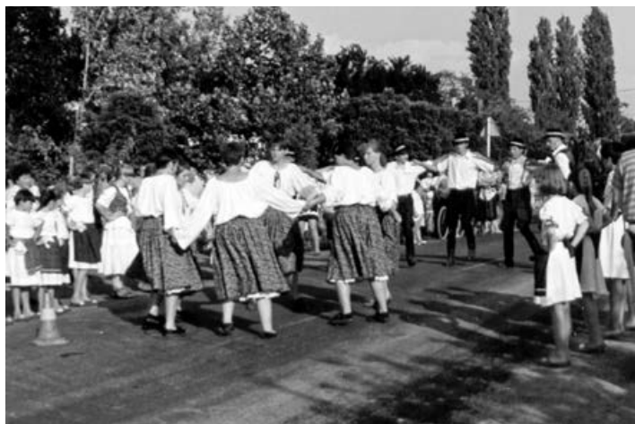
Az Olvasó Kör által szervezett egyik aratóbál