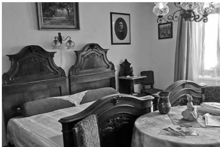
A népies bútorok visszarepítenek a múltba