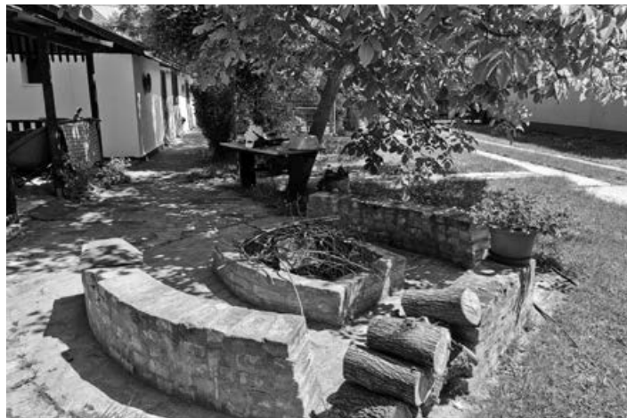
Kerti sütögető várja az vendégeket

Miután 2001-ben rátaláltunk a házra, rendszeres látogatói lettünk. Rokonokkal, barátokkal, kutyáinkkal érkezünk, bográcsoztunk, élveztük a ház nyújtotta hangulatot, ami a hagyományőrzés teremtette hangulatnak köszönhetően mindig egyfajta időutazást is jelentett. Egy olyan régi világba, ahol a dolgok egyszerűbbek voltak és az ember még kapcsolódott a természethez.