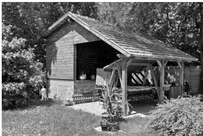
A góré színház

A Döme Ház a falu legrégebben épült házainak egyike. Nevét építőjéről, „huszár” Döme Istvánról kapta. A helyiek emlékezetében még él, hogy az épületben szegfűárusítás folyt. A ház jelenleg vendégházként üzemel és 10 fő befogadására alkalmas. Fő jellemzője a hagyományőrzés. A régi, vert falu épület alaphangulatát korhű bútorok és berendezési tárgyak alapozzák meg, míg az új épületszárnyat az élénk, vidám színek és formák jellemzik.