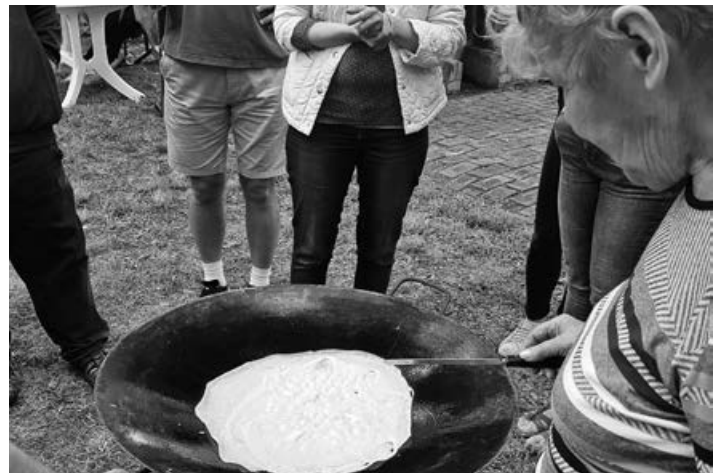
Az óriás palacsintához hosszú sor kagyózott. A kicsik az elkészült palacsintákra, az idősebbek a tárcsában sütés technikájára voltak kíváncsiak

Ismét nagy volt a gyerekzsivaj a mártélyi iskola udvarán. A falu apraja-nagyja ide érkezett, hogy együtt töltsék el ezt a nagy szerencsénkre csodaszép időjárással megáldott szombati napot. Volt aki szülőkkel, nagyszülőkkel, olyan gyermek is volt, aki a nagyobb testvérével érkezett a rendezvényre. A kicsiket ugrálóvár, kézműveskedési lehetőség, arcfestés, lovaskocsikázás és még bábelőadás is várta már a kora délelőtti órától. A kocsikázást hatalmas izgalom és érdeklődés