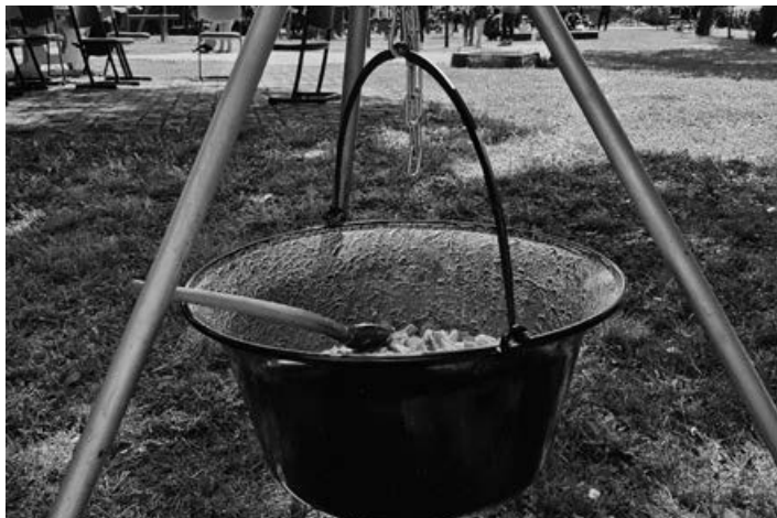
8 baráti társaság döntött úgy az idén, hogy részt vesz a bográcszásban

Az elmúlt évekhez hasonlóan ismét az Erdei- és Mártélyi Iskola udvarán rendezték meg május 29-én, szombaton a falusi Gyereknapot. Az 5 millió beoltottnak az elérése lehetővé tette, hogy megrendezzék ezt a komoly hagyományokkal bíró rendezvényt. Az Általános Művelődési Központ szervezésében lefolyt mulatságra sok falubeli kilátogatott, de még a környékbeli településekről is üdvözölhattünk családokat, akik úgy döntöttek, hogy Mártélyon töltsék el együtt a gyereknapot.