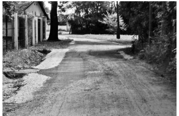
A javított útszakasz az iskola mögött